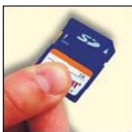
SD карта для хранения и обмена данными (формат Excel)