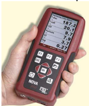
Беспроводной управляющий модуль (управление до 100 м)